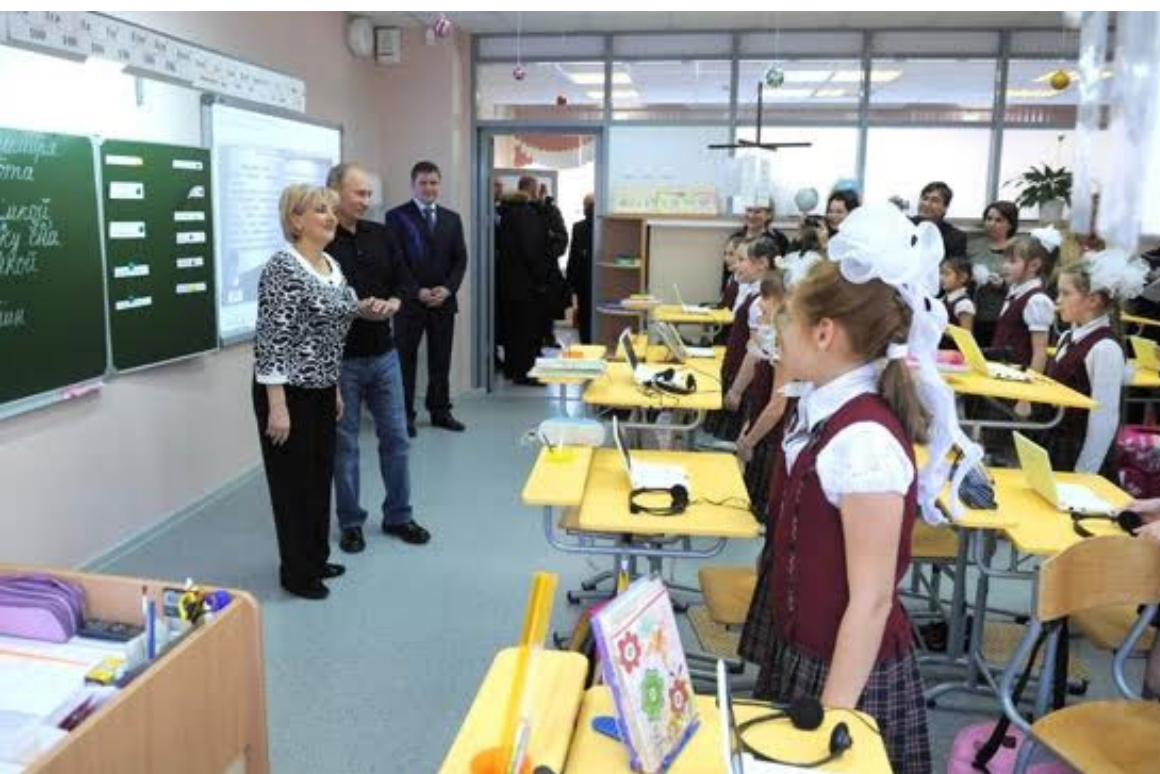
Владимир Путин в лицее «Эврика» в поселке Черёмушки