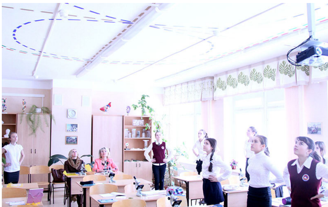
Выполнение тренажей с помощью опорных зрительно-двигательных траекторий

Для периодической активизации чувства общей, в т.ч. зрительной, координации можно использовать специально разработанную схему зрительно-двигательных траекторий (рис. 1 - не приводится). На ней с помощью стрелок указаны основные траектории, по которым должен двигаться взгляд в процессе выполнения физминуток: вверх-вниз, влево-вправо, по и против часовой стрелки, по "восьмерке".