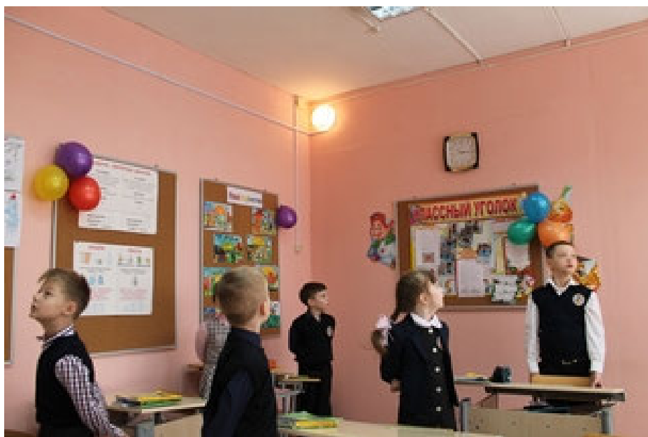
Тренаж с использованием сигнальных светильников на уроке

Направление "бегущего огонька" меняется автоматически (30 - по ходу движения часовой стрелки и 30 - против, 30 - по "восьмерке"). Скорость движения - в среднем 1 цикл за 1 - 1,5 секунды. Продолжительность упражнений - 1,5 минуты. Отключение - автоматическое.