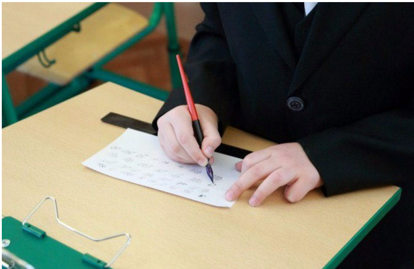
Школьник пишет пером. Школа №115, г.Ярославль

постепенному увеличению зрительной рабочей дистанции, в то время как при письме шариковой ручкой, наоборот, - к ее сокращению. Понижение уровня напряженности организма в процессе письма перьевой ручкой подтверждается и состоянием электрокожной проводимости (ЭКП). Так, если у детей, писавших шариковой ручкой, падение ЭКП, свидетельствующее о нарастании утомления, составило 29 МкА, в то время как при письме перьевой - всего 8 МкА ( P < 0,05 ).