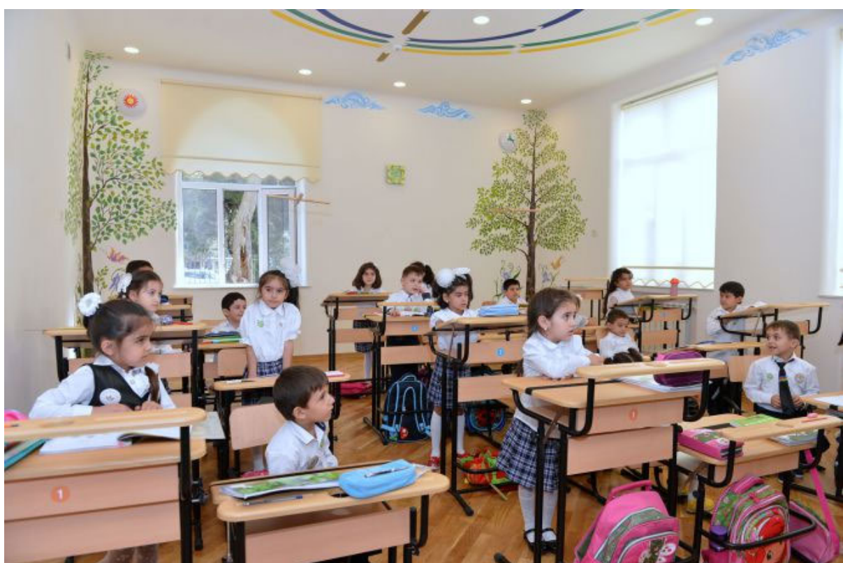
Школа №47. Баку, Азербайджан.