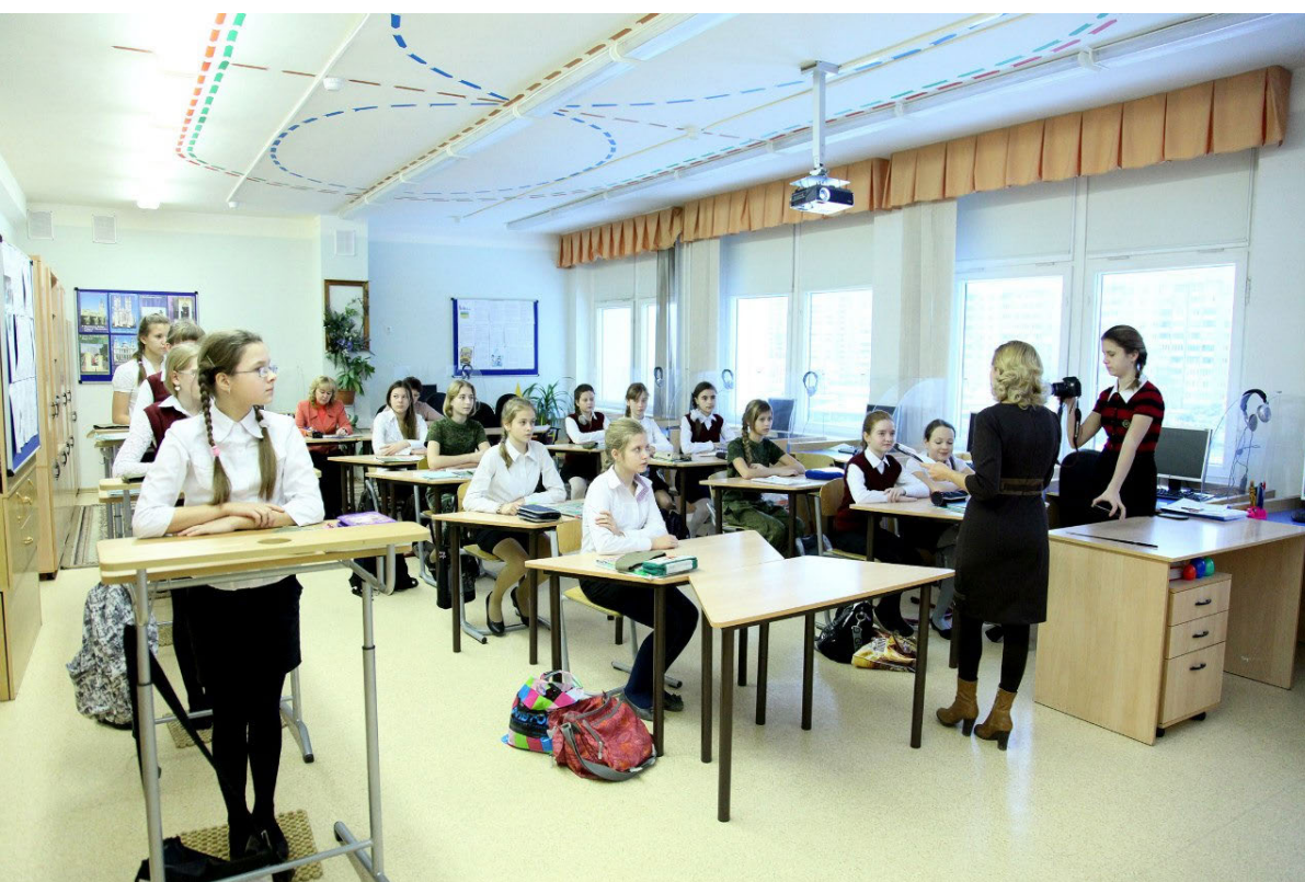
Земская гимназия, г. Балашиха