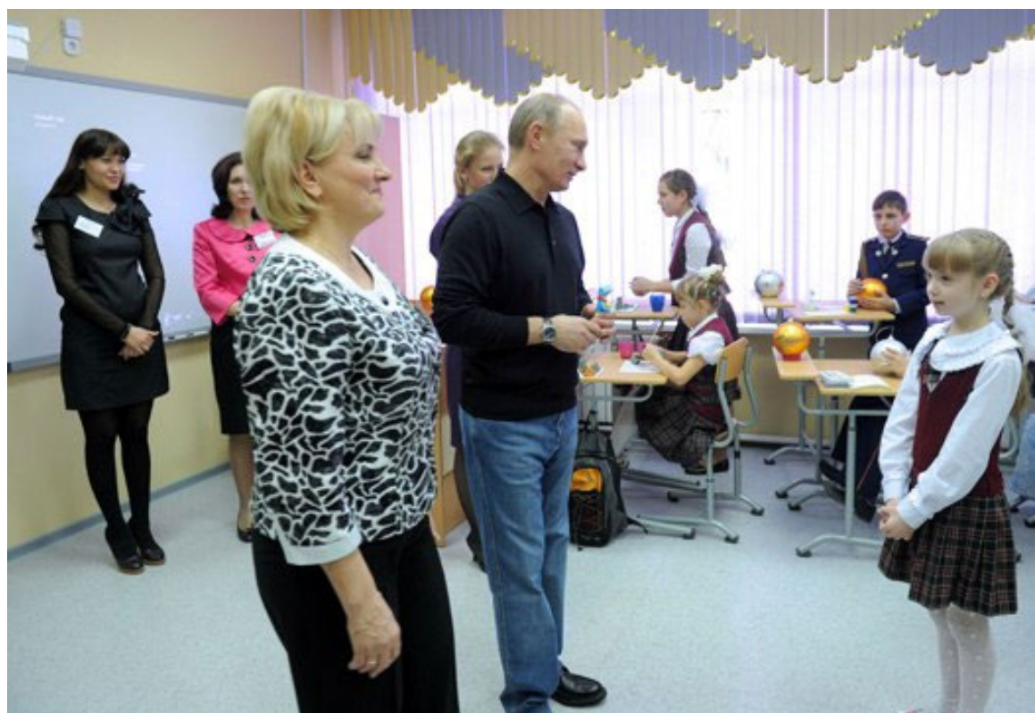
Владимир Путин в лицее «Эврика» в поселке Черёмушки